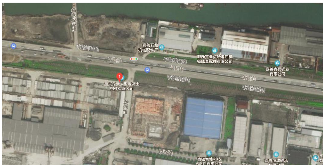
图 3-1 地理位置图