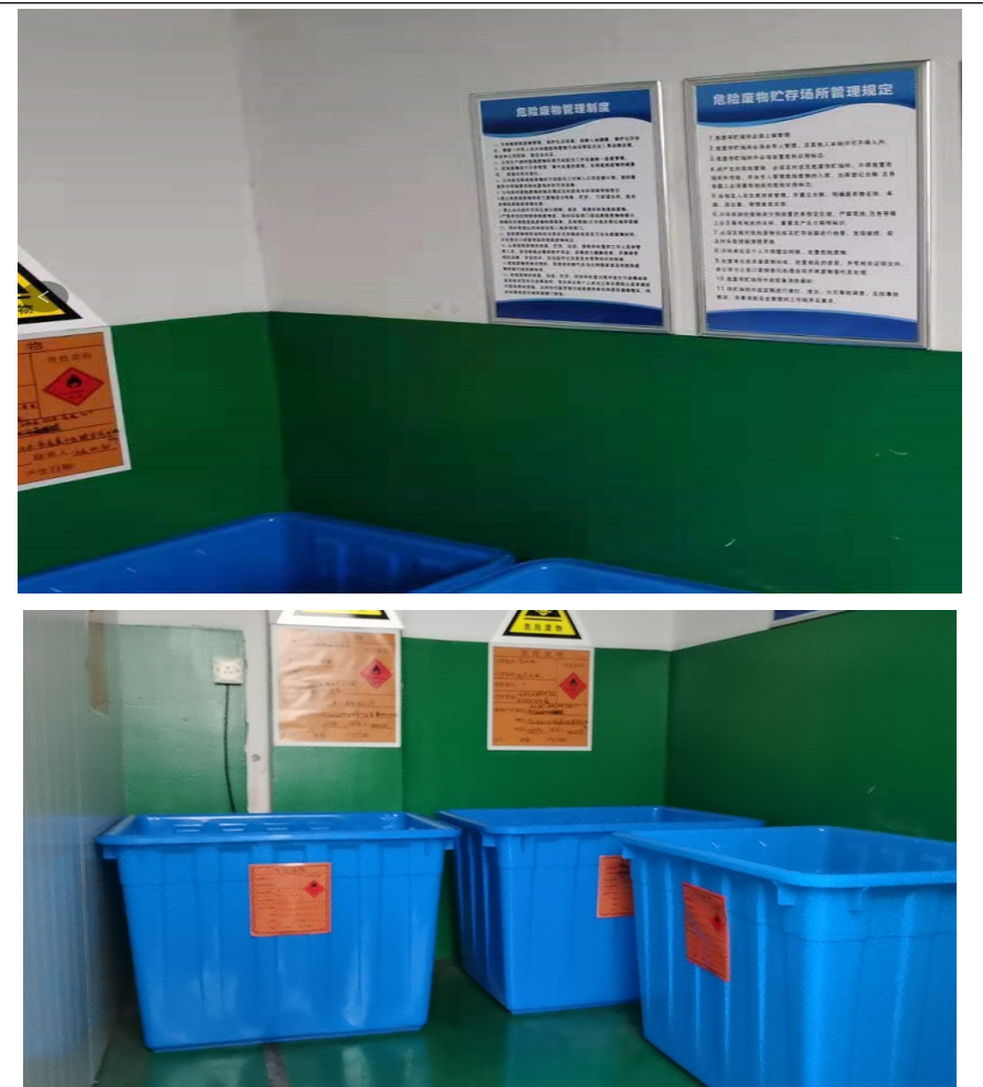
危废标识+危废管理制度+环氧地坪+分类存放