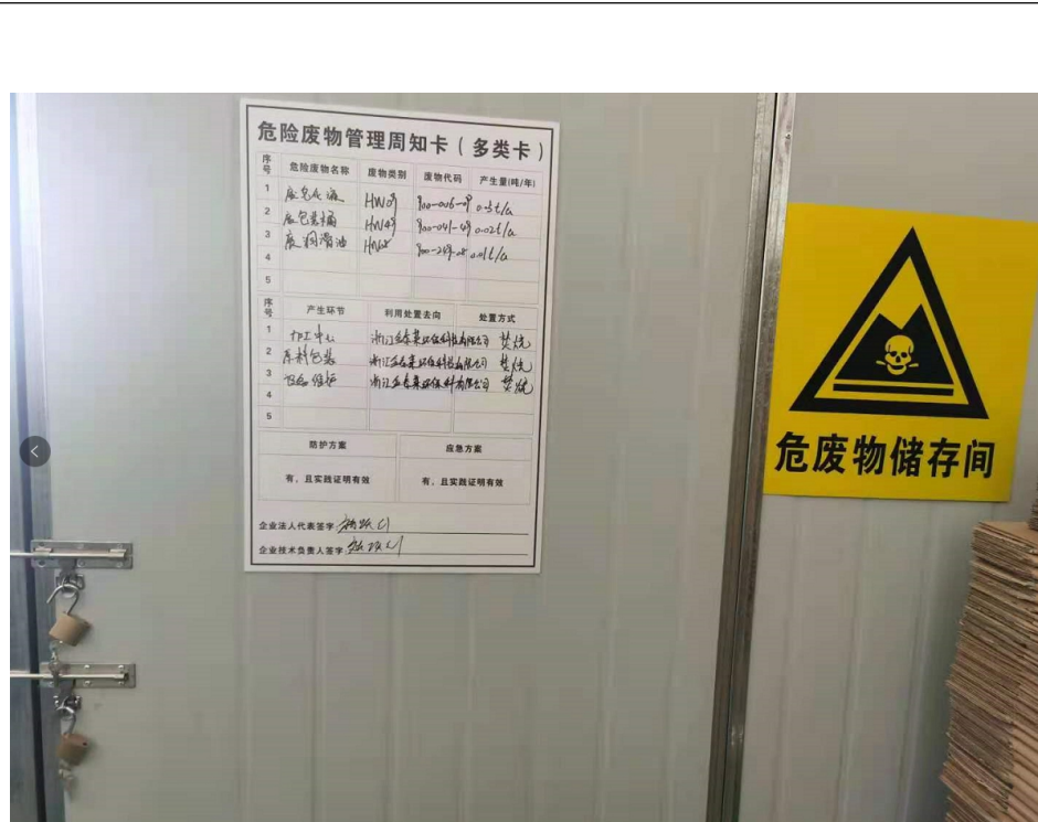
危废仓库标识+危废标识+周知卡