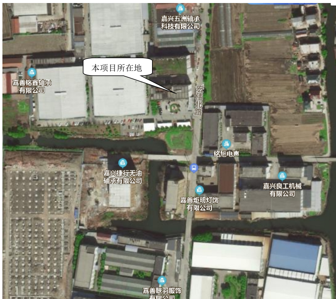
图 3-1 项目地理位置图

本项目位于嘉善县干窑镇宏伟北路 16 号 1 幢 3 楼，本项目厂区周边环境如下：厂区东侧为宏伟北路，过宏伟北路为嘉善炬明灯饰有限公司、嘉兴良工机械有限公司；南侧为河流和嘉善联羽服饰有限公司；西侧为河流和在建厂房；北侧为小路、河流和浙江双飞无油轴承股份有限公司，距本项目最近敏感点为东侧 230m 处的范泾村农居点。项目地理位置见图 3-1。